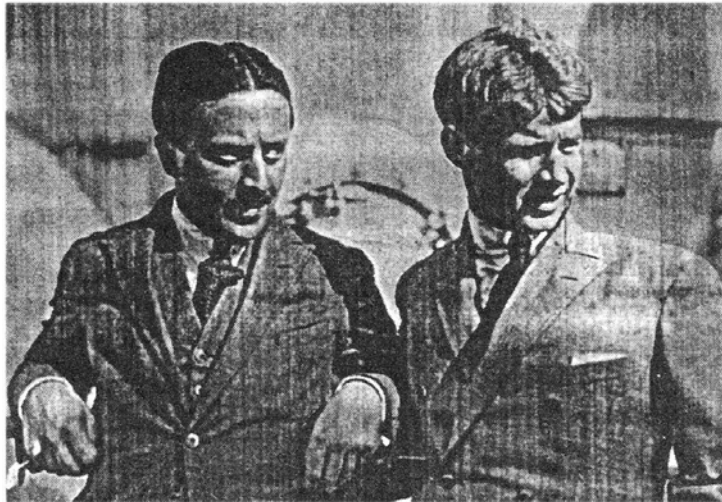
С. Есенин и А. Ветлугин. 1922 год

«Человек с коронковыми зубами», а точнее – «человек с одиннадцатью платиновыми коронками», – главное действующее лицо последней, одиннадцатой главы романа А. Ветлугина «Записки мерзавца. Моменты жизни Юрия Быстрицкого», изданного в 1922 году в Берлине с посвящением «Сергею Есенину и Александру Кусикову» [4, с. 12; 5, с. 282]. Именно эту главу накануне выхода своего романа в свет Ветлугин напечатал в «Литературном приложении» к газете «Накануне» [6, с. 3–7]. Еще раньше на страницах «Литературного приложения» были напечатаны его развернутые очерки: в самом первом номере – «Сентиментальный убийца» 2 , а чуть позже – «Нежная болезнь» о Есенине [8, с. 5–6]. В этой статье,