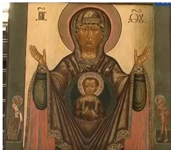
Абалацкая икона Божией Матери Знамение, 1703 г. Изограф «Сын... Сидоров». Государственная Третьяковская галерея (кадр из фильма «Искатели. Тайна Абалацкой иконы». Режиссер: С. Егоров, страна: Россия, 2013 г.)