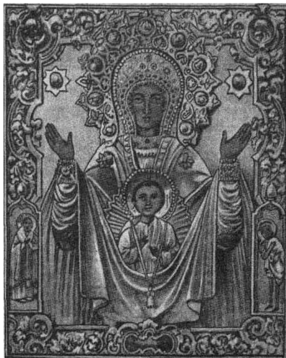
Абалацкая икона Божией Матери Знамение. Тобольск, 1637 г., изограф Матвей Мартынов (из кн.: [Сулоцкий, 1877])