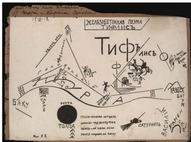
Литография В. Каменского и К. Зданевича «Тифлис» из «Железобетонных поэм» В. Каменского (1917) Lithograph by V. Kamensky and K. Zdanevich “Tiflis” (1917) from “Ferro-Concrete Poems” by V. Kamensky