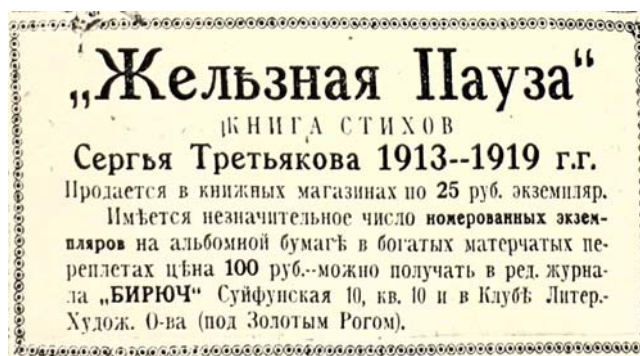
Объявление о выходе «Железной паузы» в газете «Эхо» Announcement on the release of the “Iron Pause” in the “Echo” newspaper

Дата выхода «Железной паузы» – конец 1919 г. – легко устанавливается: с середины ноября 1919 г. во Владивостокской газете «Эхо» регулярно появлялось объявление о первой стихотворной книге Третьякова, причем в объявлении заглавие выглядело даже эффектней, чем на обложке «Железной паузы», поскольку буква «п» в слове «Пауза» была едва заметно превращена в графическую эмблему паузы – // [Эхо, 1919, № 127, с. 6].